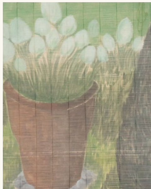
My Garden, Paju (détail), Park Chae Biole

Park Chae Dalle et Park Chae Biole réalisent également leurs propres publications dont les plus notables Frida & Guyeme pour Biole en 2020 et Montagne pour Dalle avec l'artiste Kim Wonwoo en 2021 (éditions Mother).