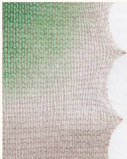
Sans titre, 2021, (détail) Park Chae Dalle