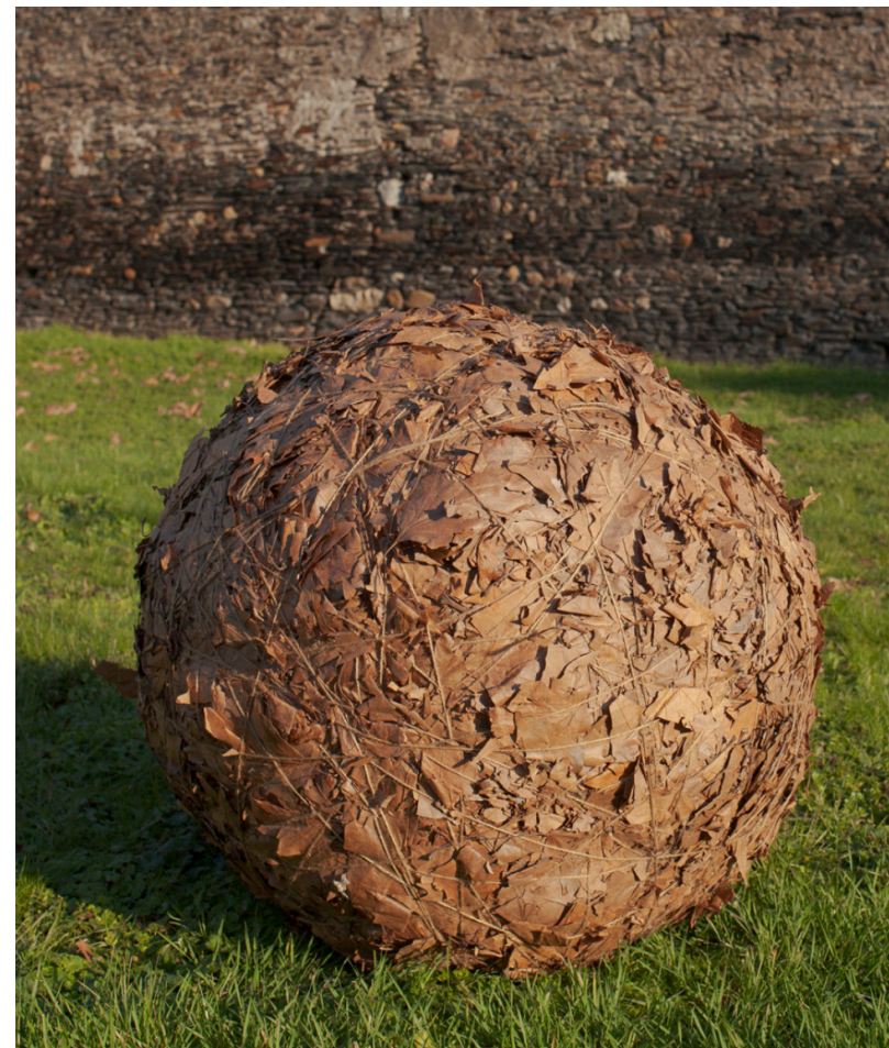
Elie Bouisson, Pelote , 2023, - Courtesy Galerie Anne-Laure Buffard