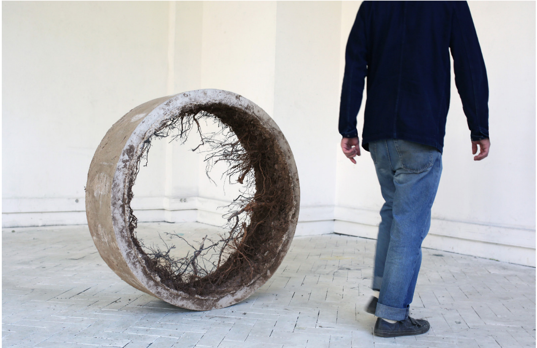
Elie Bouisson, La Ronde , 2020