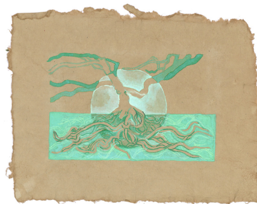
Katé Aráoz, Cartographie sensible d'un arbre (série) , 2021-22