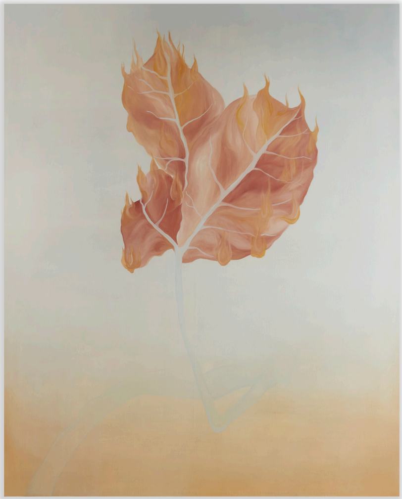
Katé Araoz, L'Automne , 2021-23