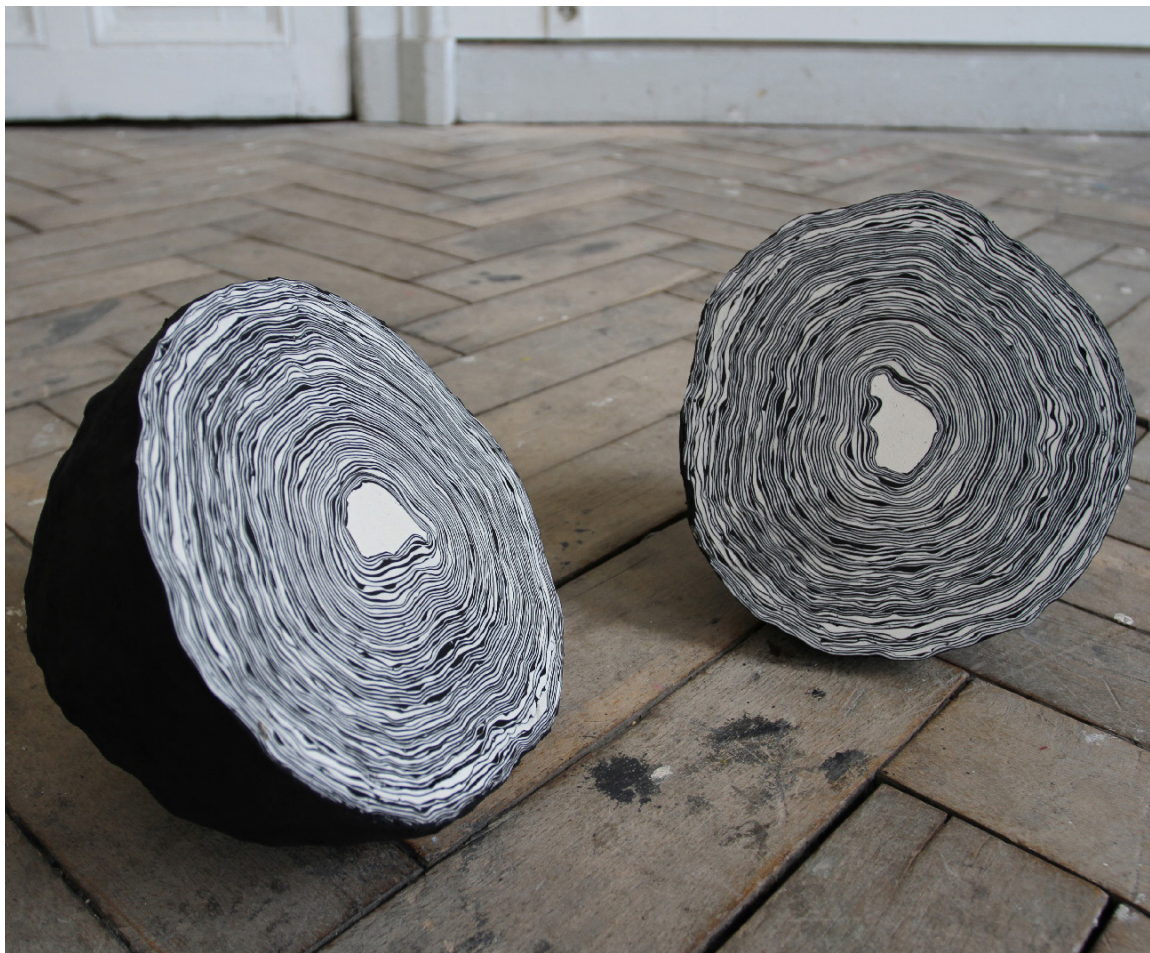
Elie Bouisson, Dans ma main , 2023, - Courtesy Galerie Anne-Laure Buffard